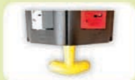
Mango para sujeción