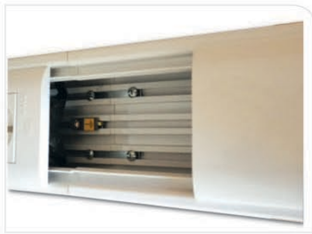
b) Vista de interior de canal con tierra y uniones de canal colocadas.

Tapa frontal curvilínea como bastidores de toma.