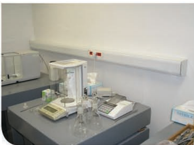
c) Instalación de canal frontal a nivel de mesada de trabajo o a nivel de zócalo según cada necesidad.