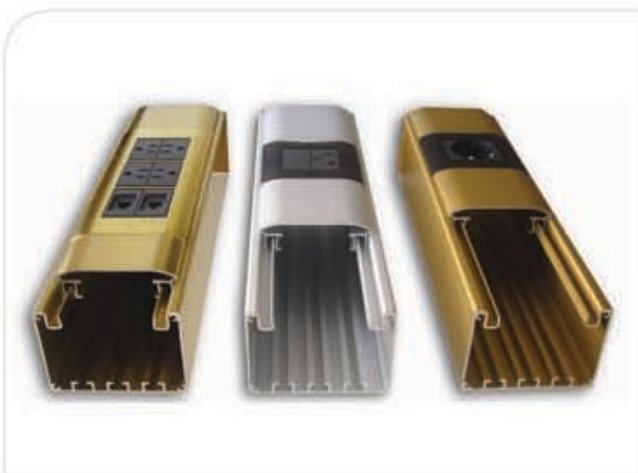
a) Variedad de colores y terminaciones.

Su elegante diseño y acabado con tapas frontales desmontables y curvilíneas quedan totalmente a ras de los bastidores de tomas y conectores, permitiendo la integración en cualquier espacio: ya sea de oficinas, salas de reuniones, laboratorios, clínicas y hospitales como así también salas de espera y locales comerciales, entre otros.